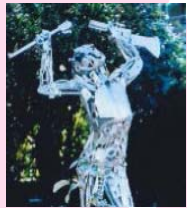
Musik für den Frieden ab 19.00 Uhr Anti-Kriegs-Museum Brüsseler Straße 21