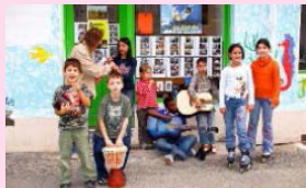
Musik von Kindern- aber nicht nur für Kinder 17.30 Uhr Seepferdchen e.V. Brüsseler Str. 43