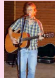
Chris (Country, Folk & Rock) ab 19.00 Uhr Gaststätte „Klein Zaches“ Antwerpener Straße 43