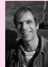
HERRMANN 19.30 Uhr Gaststätte „Kutscher Eck“ Brüsseler Str. 5